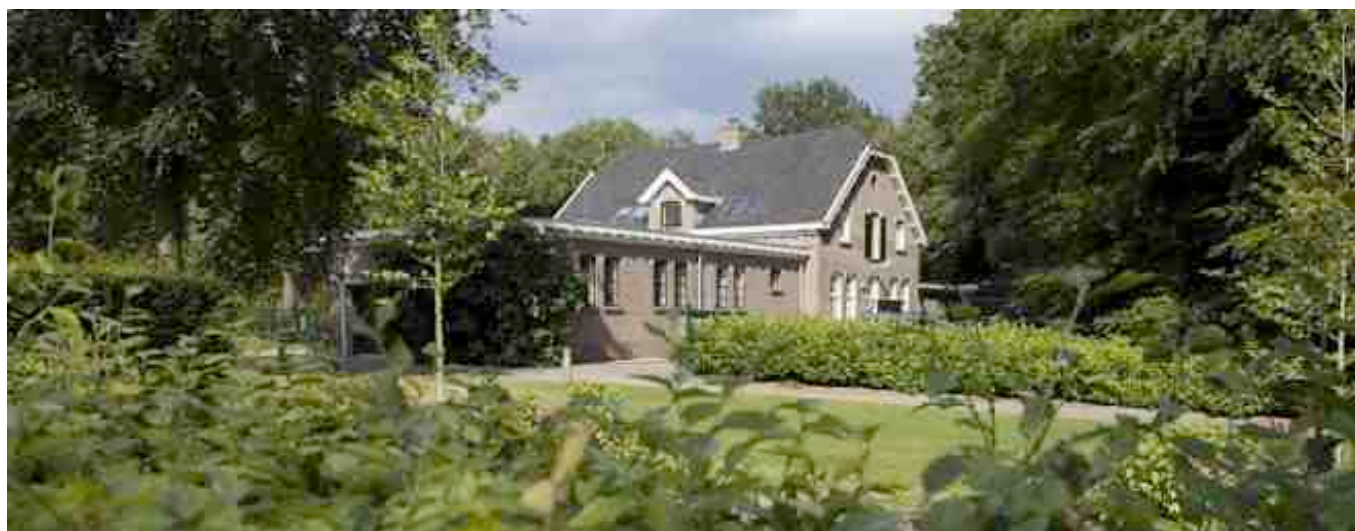
De boerderij op het landgoed Bronbeek. Het gebouw, toch al niet al te groot, wordt ook nog eens voor het grootste deel in beslag genomen door de opslag van landbouwmaterieel van het Ministerie van Defensie.

Als Defensie voet bij stuk houdt, is de toekomst van het I.H.C. erg onzeker. In ieder geval op het Landgoed Bronbeek.