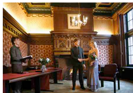
Een van de schitterende kleine zalen, die tevens gebruikt kunnen worden als trouwlocatie.

De overige afdelingen van het KIT, die zich richten op duurzame ontwikkelingen in Zuid en Midden Amerika, Afrika en Azië zouden wel voor financiering in aanmerking blijven komen.