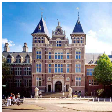
Koninklijk Instituut voor de Tropen in Amsterdam.

Het Koninklijk Instituut voor de Tropen (KIT) met daaraan verbonden het Tropen Museum en het Tropen Theater in Amsterdam verkeert in zwaar weer. En dit drukken we nog voorzichtig uit. Het is geen zwemmen of verzuipen, maar als de overheid haar plannen niet wijzigt of bijstelt, is het voor het KIT echt kopje onder.