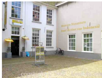
Museum Nusantara in Delft.

Als de sluiting per 1 januari 2013 doorgaat, dan zal de collectie unieke Indisch culturele objecten een slapend bestaan gaan leiden ergens in een of andere opslagruimte. Het pas verbouwde museum zal dan worden ingenomen door collecties van Delfts Blauw Aardewerk.