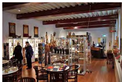
Overzicht van een deel van de unieke collectie Indische artefacten.

Alleszins een zeer merkwaardige gang van zaken. Eerst een kostbare opknopbeurt, dan sluitingsdreiging en terwijl dat nog niet eens een feit is, is ook de nieuwe invulling van het gebouw al bekend. Wij kunnen ons er dan ook niet aan onttrekken dat dit de schijn geeft van vooropzet.