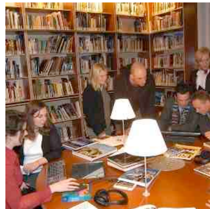
De bibliotheek van het Koninklijk Instituut voor de Tropen. Een unieke informatiebron

Nu, anno 2011 wordt het Koninklijk Instituut voor de Tropen in haar voortbestaan bedreigd. Zoals zovele waardevolle culturele instellingen zal het ten prooi vallen aan de niets ontziende bezuiningsdrift , aldus blijkt uit een brief van het Ministerie van Buitenlandse Zaken. In deze brief wordt gesteld dat vanaf 2013 het Tropenmuseum, het Tropentheater en de Bibliotheek van het KIT geen enkele financiering van het ministerie meer zullen ontvangen.