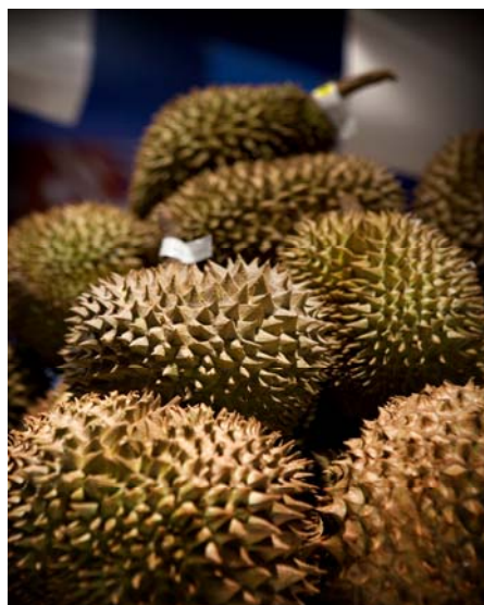
Doerians op de TongTong fair 2008

Een aantal andere positieve bindingen werd veel genoemd, zoals gezelligheid, warmte, geborgenheid, met weinig woorden elkaar begrijpen, muziek, dansen en lekker eten.