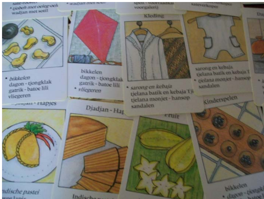
Indomemo Kwartetspel, ontworpen door Bureau van der Star en Stichting Pelita

Indische senioren behoefte is aan doelgroepspecifieke voorzieningen. Naar hun inschatting zal dat de komende jaren ook nog .zo zijn Niet alle Indische ouderen ervaren die behoefte, bleek uit de reacties van de doelgroep zelf, maar een redelijk aantal wel. Hoe groot de behoefte in de hele doelgroep is, is op basis van mijn data niet te zeggen.