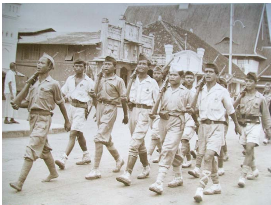
Marcherende Indonesiërs

In 1947 en 1948 doet Nederland met twee gewelddadige politioenele acties nog een laatste poging om het gezag te herstellen. Dit leidt tot grote internationale verontwaardiging, die Nederland politiek onder druk zet om serieuze onderhandelingen te voeren over de onafhankelijkheid. Uiteindelijk wordt op 27 december 1949 de soevereiniteit overdragen aan Soekarno. Hierbij wordt een aantal afspraken gemaakt die bepalend zouden zijn voor de toekomst van alle Indische Nederlanders.