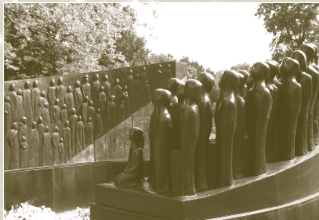
Indië-Monument Amstelveen Beeldhouwer: Ella van de Ven

14 augustus 2009 - Broersepark Amstelveen