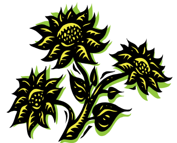
Tekening van zonnebloemen