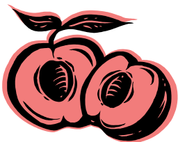
Tekening van perziken