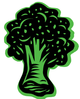
Tekening van broccoli