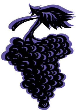
Tekening van druiventros